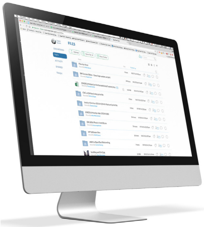
OpenText Core Share